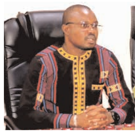
Le ministre d'Etat en charge de la communication, Rimalba Jean Emmanuel Ouédraogo, a invité ses collaborateurs de l'Est à poursuivre la dynamique.

Le ministre d'Etat, ministre de la Communication, de la Culture, des Arts et du Tourisme, Rimalba Jean Emmanuel Ouédraogo, a rencontré, vendredi 28 juin 2024, à Fada N'Gourma, ses collaborateurs des services déconcentrés. Il les a félicités pour « la qualité du travail abattu ».