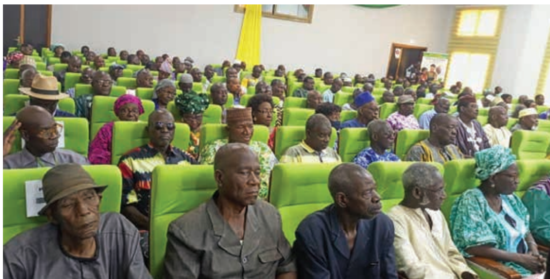
Cette opération est une joie et un ouf de soulagement pour ces pensionnés.