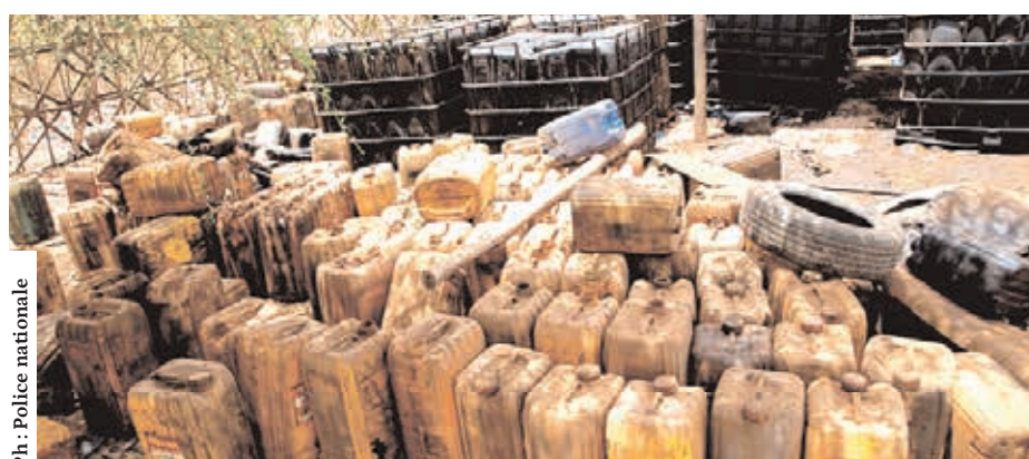
Un échantillon du matériel utilisé pour le trafic.

Direction de la communication Police nationale