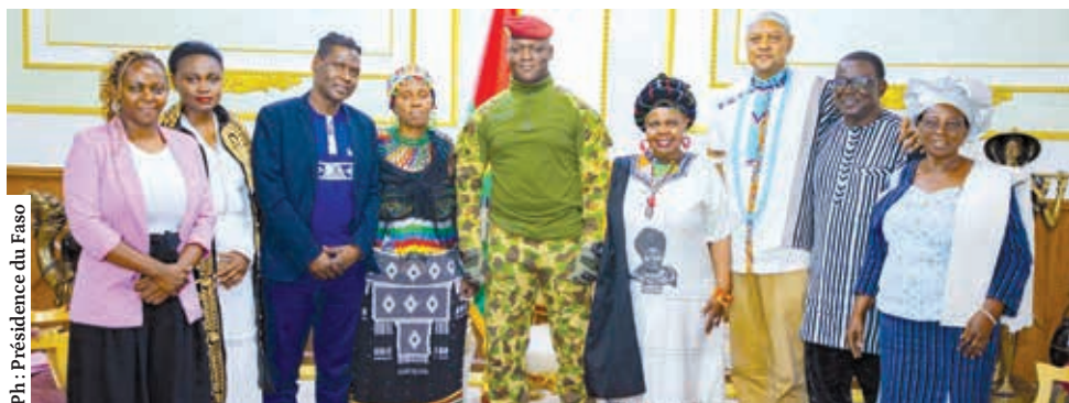
Le Mouvement panafricain Afrique et diaspora a apporté son soutien au Président du Faso, Ibrahim Traoré, pour sa mission de libération économique, politique et sociale du Burkina.

Le Président du Faso, le capitaine Ibrahim Traoré, a reçu en audience, mardi 2 juillet 2024, le Mouvement panafricain Afrique et diaspora. Le mouvement est solidaire de la lutte menée par le Burkina Faso et veut apporter son soutien pour l'atteinte des objectifs de la Transition.