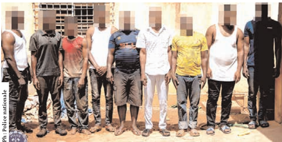
Ces individus répondront de leurs actes.

La Police nationale, à travers le Service régional de la police judiciaire (SRPJ) du Centre, dans le cadre de ses missions de lutte contre la criminalité urbaine, a procédé au démantèlement d'un réseau de présumés délinquants spécialisés dans le vol et le recel des hydrocarbures commandés par la Société nationale burkinabè d'hydrocarbures (SONABHY) et à destination de la Société nationale d'électricité du Burkina (SONABEL).