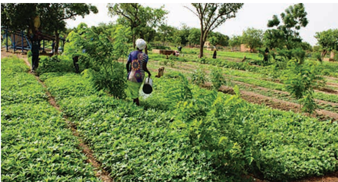
La ferme agro-écologique polyvalente de Moundasso à Dédougou...

Aménagée en 2023 par le Programme des Nations Unies pour le développement (PNUD), à travers le Programme d'amélioration des moyens d'existence durable en milieu rural (PAMED), sur une superficie de deux hectares, la ferme agro-écologique polyvalente de Moundasso (Dédougou) est répartie en 132 parcelles. Elle dispose d'un forage et des équipements, faisant la fierté de 103 exploitants dont 29 personnes déplacées internes (PDI) et 74 personnes issues de la population hôte. Formés en techniques culturales durables, en fabrication de biofertilisants, biopesticides, les occupants des lieux tirent leur épingle du jeu.