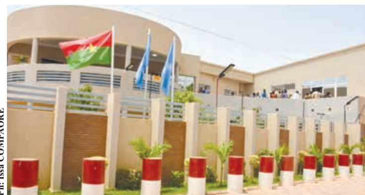
Le nouveau Bureau pays du FIDA au Burkina Faso va permettre au Fonds de se rapprocher davantage des populations rurales.