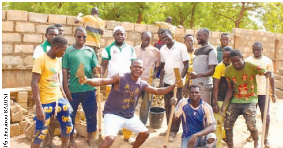
Les jeunes se sont engagés à accompagner les autorités par des actes patriotiques.

vraiment les actes commis par la foule dans leur mécontentement. Nous sommes là pour corriger ces erreurs et rassurer tout le monde que cela ne se reproduira plus à Ouahigouya. Nous invitons la jeunesse à un sursaut patriotique, à se mobiliser tous autour de nos autorités pour le retour de la paix », a-t-il soutenu. Cette initiative est saluée par le directeur régional de la RTB2/Nord. « Au nom du ministre d'Etat, ministre de la