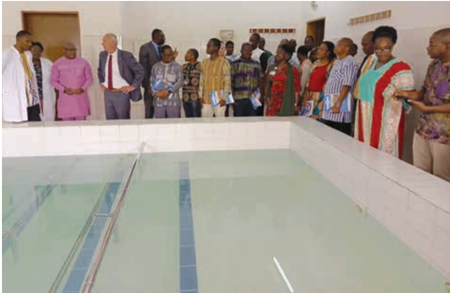
Au CNR-MPR, la balnéothérapie est disponible.