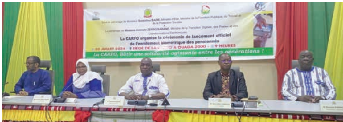
Le ministre d'Etat, en charge de la protection sociale Bassolma Bazié (milieu) a invité les pensionnés à une forte mobilisation lors des 4 mois de campagne.

L'engagement de la Caisse autonome de retraite des fonctionnaires (CARFO) à bâtir une solidarité agissante entre les générations et renforcer sa proximité avec ses assurés sociaux ne faiblit pas. Elle a lancé une opération d'enrôlement de ses pensionnés dans la matinée du 2 juillet 2024 à Ouagadougou, en présence du ministre d'Etat, ministre de la Fonction publique, du Travail et de la Protection sociale, Bassolma Bazié.