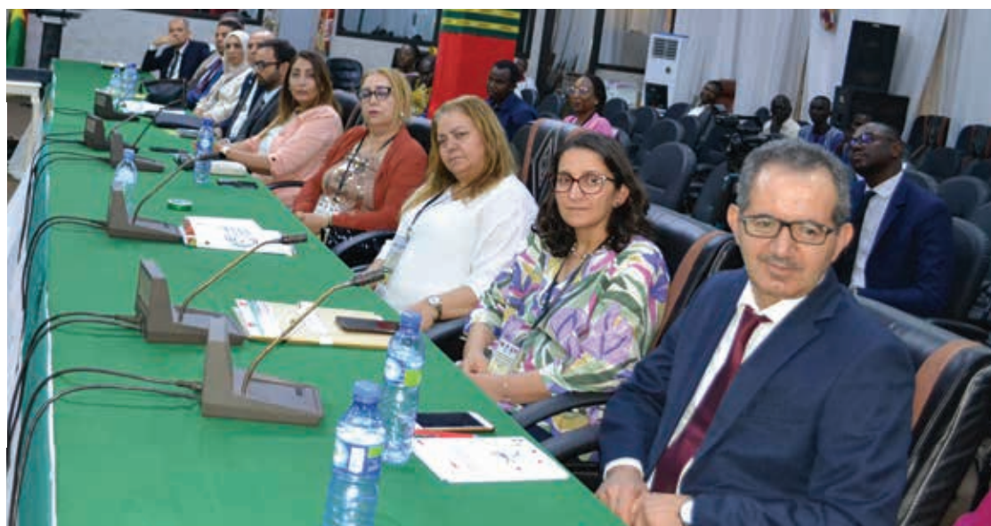
La 9 e session de la commission mixte de coopération Burkina-Tunisie se tiendra en 2026 en Tunisie.