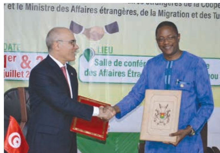
Selon les chefs de la diplomatie des deux pays, les échanges se poursuivront pour la signature des protocoles d'accord restés en suspend.

tures concernées », a relevé le rapporteur général, Issa Borro. Par ailleurs, les experts ont fait des recommandations pour le renforcement de la coopération entre le Burkina et la Tunisie dans plus d'une dizaine d'autres secteurs. En termes de conclusion, il est ressorti que les deux parties ont convenu de poursuivre les échanges autour des projets d'accords dans les domaines de la sécurité et de la protection civile et de la gestion des risques en vue de leur signature prochaine, dans les meilleurs délais. Au regard des résultats atteints à la fin des tra-