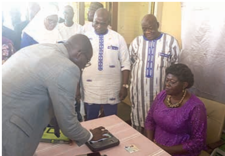
Une pensionnée s'est enrôlée et a reçu son ticket au bout de 2 mn.

Le ministre d'Etat, ministre de la Fonction publique, du Travail et de la Protection sociale, Bassolma Bazié, a présidé la cérémonie de lancement officiel de l'enrôlement biométrique des pensionnés de la Caisse autonome de retraite des fonctionnaires (CARFO), le 2 juillet de 2024 à Ouagadougou