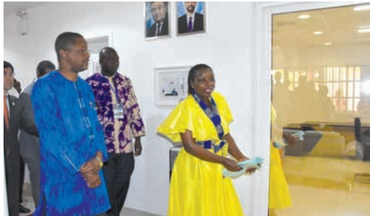
Les autorités gouvernementales et les responsables du FIDA ont visité les locaux du joyau.

Présent au Burkina Faso depuis 1981, le Fonds international de développement agricole (FIDA) y est désormais implanté définitivement avec son nouveau Bureau pays au profit des populations rurales. L'infrastructure, flamboyant neuf, à niveau comportant plusieurs locaux, a été officiellement inaugurée par le ministre des Affaires étrangères, de la Coopération régionale et des Burkinabè de l'extérieur, Karamoko Jean-Marie Traoré et les premiers responsables du FIDA, mardi 2 juillet 2024, à Ouagadougou, dans le quartier Ouaga 2000. Le ministre Traoré a d'emblée loué les efforts du FIDA en matière d'amélioration de la fertilité des sols, des rendements agricoles et des conditions de vie des paysans avant de traduire la disponibilité du Burkina Faso à l'accompagner. Selon les dirigeants du Fonds, son implantation au pays des Hommes intègres va améliorer davantage les conditions de vie des bénéficiaires tout en œuvrant à un développement agricole durable et résilient en collaboration avec l'Etat, ses