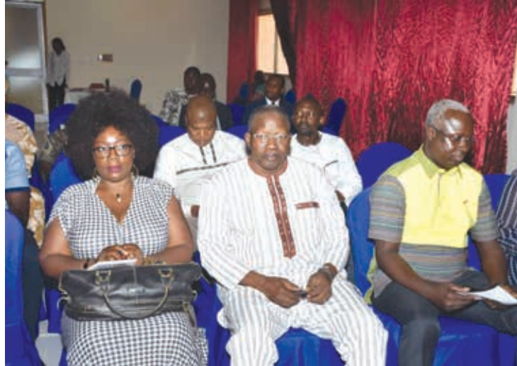
Les participants ont été témoins de la présentation du rapport de Endeavour Mining.